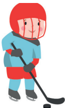
h = dż